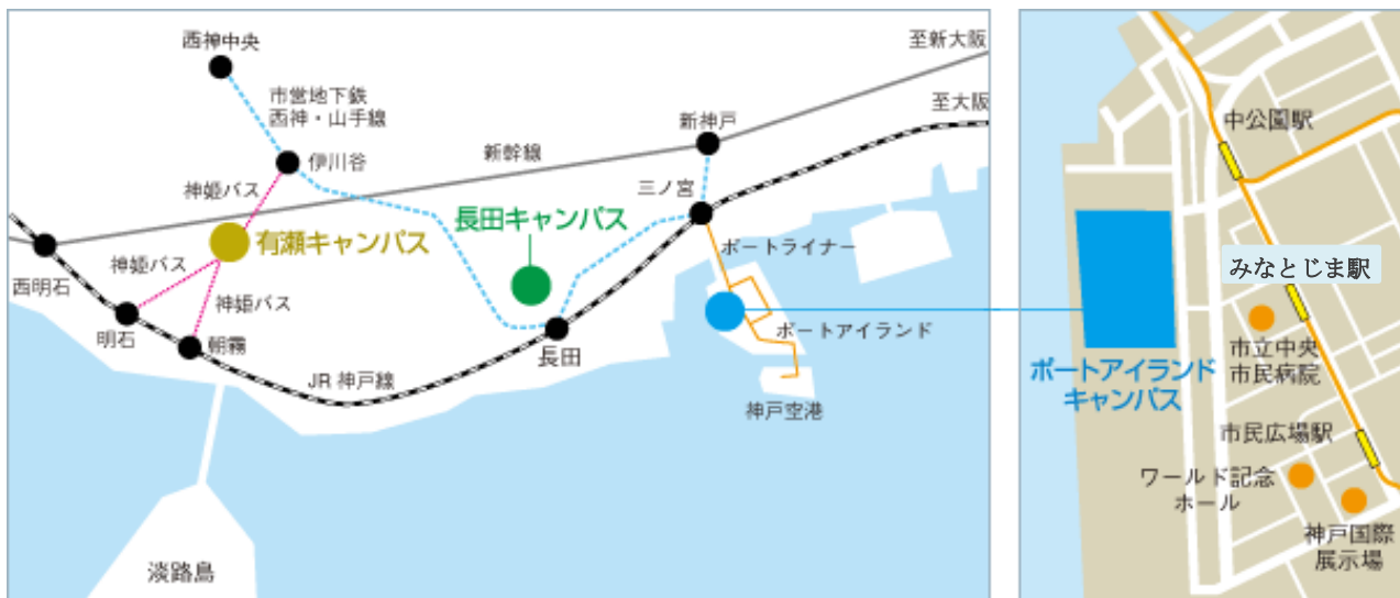
神戸学院大学ポートアイランドキャンパス配置図